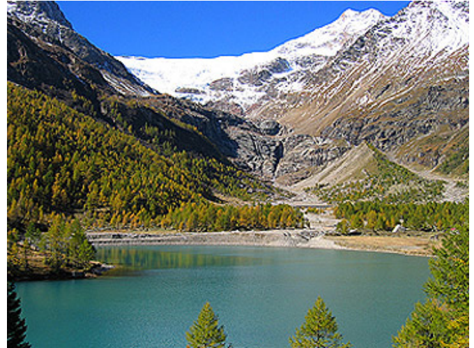
Der Palügletscher mit dem gleichnamigen See

Die detaillierten Beschreibungen erhält man im Format PDF indem man den entsprechenden Weg anklickt: