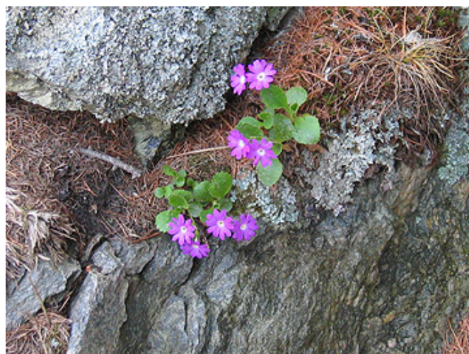
Respektieren wir die Natur

Das Val Poschiavo bildet ein einmaliges Wandergebiet, dank einer an Kontrasten reichen Topographie und einem dichten sehr gut markierten Netz von Wanderwegen. Das Wasser der Bäche ist klar, die Luft rein. Die Natur ist noch frei von Umweltbelastungen und reich an Wäldern und Seen; das Klima von Mai bis Oktober mild. Die Fahrt mit dem Bernina-Express (Trenino rosso) mit Sicht auf Piz Bernina und Palü verkörpert ein einmaliges Erlebnis. Ausserdem hält das Val Poschiavo verschiedene kulinarische, kulturelle und architektonische Überraschungen für Sie bereit.