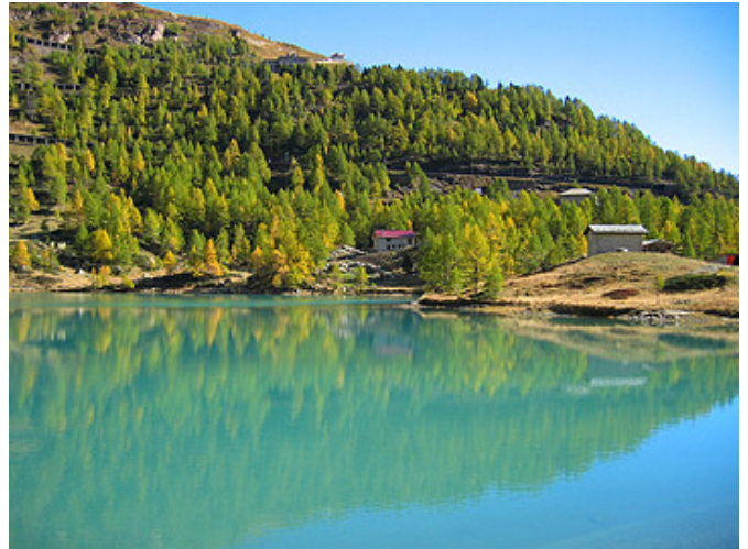
Agriturismo Alpe Palü mit dem Gletschersee